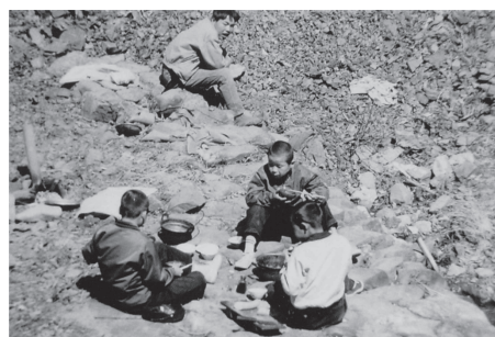
1961年の様子。まだ石囲いを作っていない

河原の粥を炊く場所へ円形に大きめの石を並べ囲い、その囲いに沿ってかまどとひな人形を飾る祭壇が作られる。北側に祭壇、南側にかまどがそれぞれ置かれる。石囲いは、1974年から行