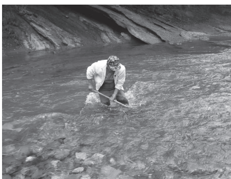
きれいな石を入れるために川底をすり鉢状に掘る

この日は、雨上がりの横瀬川で約10人の同会員や同組合員らが協力してマヤ床を作った。雨が続き、水量が倍になった川に入り通常時の水かさを計算して、足で砂利を踏み固めて石の状態や川底の段差などを確認しながら完成させた。翌日の朝には、待っていたように20cmを超える大型のウグイが大量に集まってきたそうで、大量の稚魚の誕生が期待される。