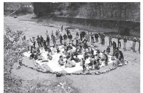
今年、地区の子どもたちが集まり合同で行なわれた。