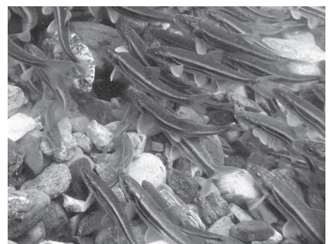
設置の翌朝に産卵のためマヤ床に集まってきた大型のウグイ