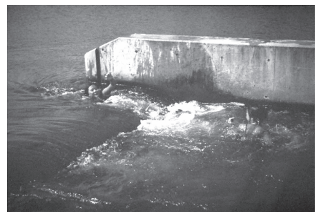
日野用水堰のハーフコーン型魚道で遊ぶ子どもたち

熊本市では、秋から春まで田んぼを使わない季節に水を溜める「冬水田んぼ」に参加する農家に助成金を出している。入間川流域でもそういう地下水涵養の努力をして、平常時の入間川を太らせるようにすべきだと思う。