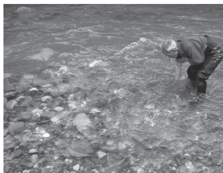
上流側に大きな石。下流側に産卵用の小さな石を置いたマヤ床