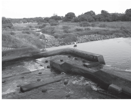
上流側に向けた笹井堰の魚道。水量も多く落差も大きい

水が流れる低水路を真ん中に寄せて魚道を設置するか、左岸側にハーフコーン型魚道を1/11の勾配でセットバック（半分堰から上に出して）し、副