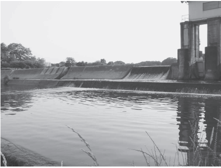
笹井堰の全景。エプロンの下流端には1m位の落差が

1段の落差も大変大きく、最下流は水が空中に飛び出している。裏に空気の層が見えるような落差は造ってはいけない。