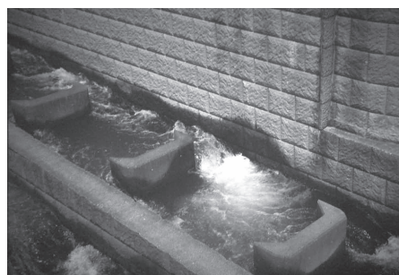
危険が多く、管理が難しいアイスハーバー型魚道

アイスハーバー型魚道のもう一つの問題は、人間にも危険なことだ。隔壁下部の潜孔に子どもの足が吸い込まれた場合、流速が速いので吸い込まれると生命に関わる。この魚道で既に2名