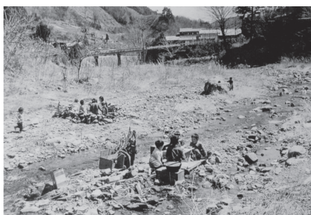
1974年の様子。男女別々に石囲いを作るようになった