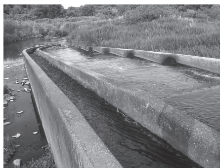
河道中央部にカーブした豊水橋床固め工の魚道

魚道下流が流心向きにカーブしている構造のため、下流端が土砂とクサヨシに覆われ流れが速くかつ乱れている。