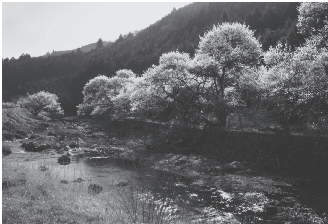
満開の桜の下を流れる成木川（青梅市成木四丁目）

発行●NPO法人荒川流域ネットワーク編集委員会／編集人●鈴木勝行 住所●358-0046埼玉県入間市南峯400-4 FAX04-2936-4120 ホームページ●http://arariver.org/