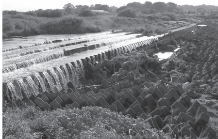
洗堀により大きな落差が発生してしまった上奥富堰

差に対応はできるが、農業用水の取水量が非常に大きい特殊な条件であれば、現状を承認して新たに魚道だけ設けることも可能だが、その比率がそれ程高くない上奥富堰は堰そのものを改築した方がいいと思う。